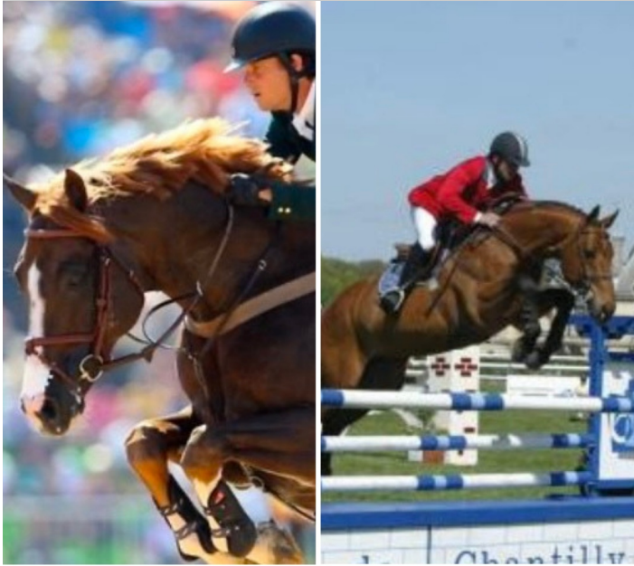
QUABRI DE L'ISLE